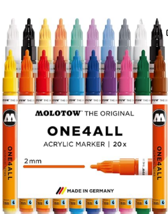
Molotow One4All - Rotulador acrílico 20 unidades https://amzn.to/3GBJnZt